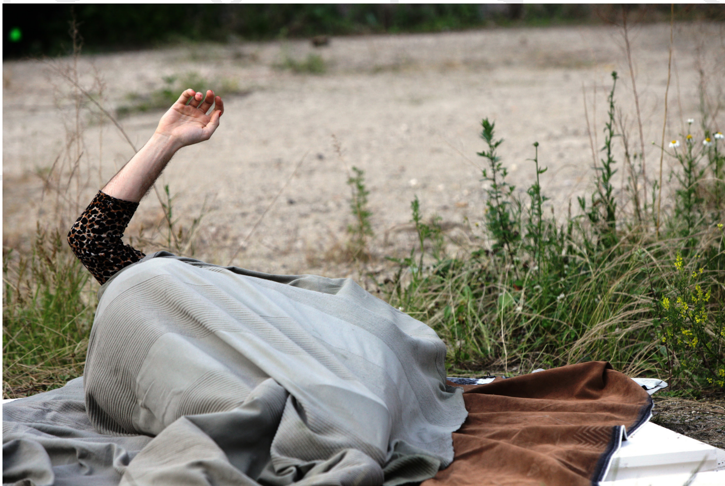
Photo Jean-Michel Coubart - Premières / Paris 13 / Coopérative 2r2c

VIES PARALLÈLES Pièce-Performance pour terrain vague